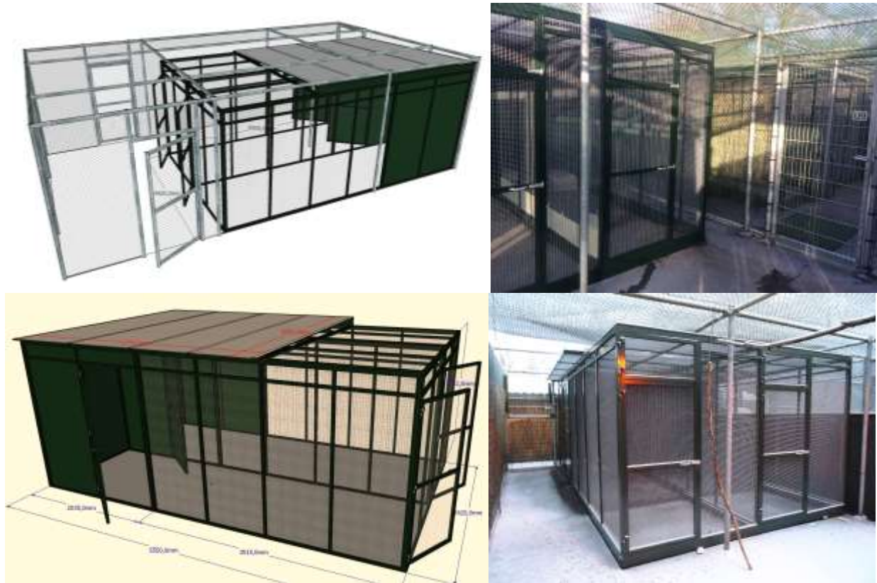
Figuur 10. Fase 1 van het huisvestingsplan: 3D weergave van ontwerp nieuwe volières (links) & foto's van hoe het geworden is (rechts).

Fase 2 van het huisvestingsplan bestaat uit de bouw en inrichting van een zoogdierenverblijf met behandelafaciliteiten op de plek van de afgeschreven buitenvolières naast de nieuwe pauzeruimte. De fondswerving voor dit project zal naar verwachting nog zeker tot kwartaal 4 in 2016 duren en kan niet eerder starten dan wanneer het gehele bedrag geworven is.