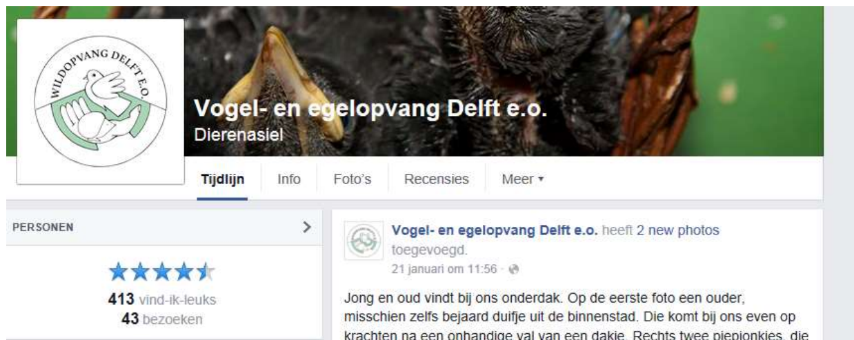
Figuur 2. Screenshot van onze Facebookpagina in januari 2016.

Het uitbrengen van donateursblad de Penneveer (2x per jaar) en het continu actueel houden van de website, facebook en twitter zijn uiteraard wel voortgezet in 2015. Een goede ontwikkeling hierbij is dat de vaste krachten in toenemende mate ook berichten op onze facebook pagina plaatsen en het aantal volgers inmiddels gegroeid is, zie figuur 2. De eerste Penneveer 2015 is in juni verspreid onder de donateurs. De tweede Penneveer is in november/december 2015 weer verschenen in een oplage van 500 stuks en verspreid.