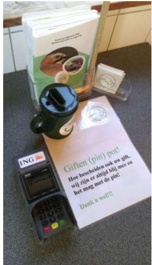
Figuur 7. Giftenhoekje in de eerste opvang

Specsavers heeft ons gevraagd in 2015 opnieuw mee te doen aan hun wedstrijd om sponsorgeld in 2016 te winnen (vorig jaar hebben we niet gewonnen). Een van onze nieuwe aspirant-bestuursleden heeft zich enorm ingezet om zo veel mogelijk online stemmen te werven, het zijn er uiteindelijk enkele tienduizenden geworden, en met succes, zie figuur 8. Dit zal ons inkomsten voor 2016 opleveren.