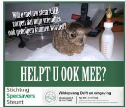
Figuur 8. Uitslag Specavers wedstrijd.

Vanaf 1 januari 2016 gaat Specsavers Delft, waarvoor u zich heeft ingeschreven, een jaar lang sparen voor Stichting Vogelasiel Delft. Daarnaast spaart de winkel ook voor een landelijke doel. We maken in januari 2016 bekend welk doel dat is. Voor elk verkocht montuur of hoortoestel doneert de winkel een vast bedrag aan Stichting Specsavers Steunt. De spaarronde loopt tot en met 31 december 2016. Pas in 2017 is de opbrengst voor Stichting Vogelasiel Delft bekend. Het is helaas niet mogelijk om tussentijds donaties te doen.