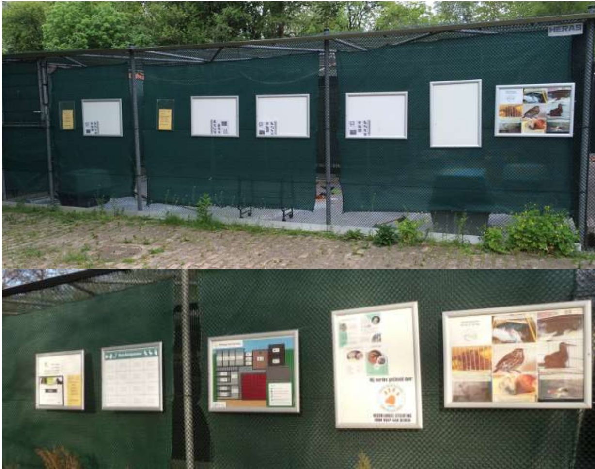
Figuur 4. Educatieve schutting in het voorjaar (boven) het najaar (beneden) van 2015.

het buitengedeelte van onze opvang en de dieren in de verschillende volières. Aan nieuwe seizoenposters (meest rechter kliklijst) wordt in 2016 verder gewerkt.