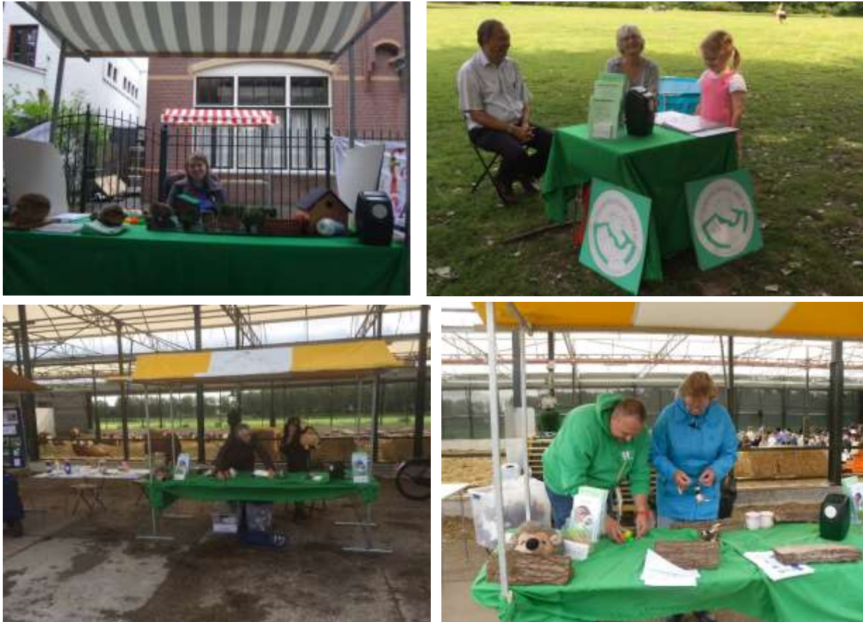
Figuur 3. Foto's van de informatiekramen op Groenmarkt Leeuwendaal (boven - L), Hondenplezier Delft (boven - R) en de Bieslanddagen (onder).

In 2015 hebben we op vier evenementen gestaan met een kraam/tafel. In april op de Koningsdag rommelmarkt in Bodegraven, in mei op de "Groenmarkt Leeuwendaal" in Rijswijk, begin juli op het evenement "Hondenplezier Delft" in Delft en 5/6 september bij de Bieslanddagen in Delft. Beide dagen met een andere bezetting, zie figuur 3.