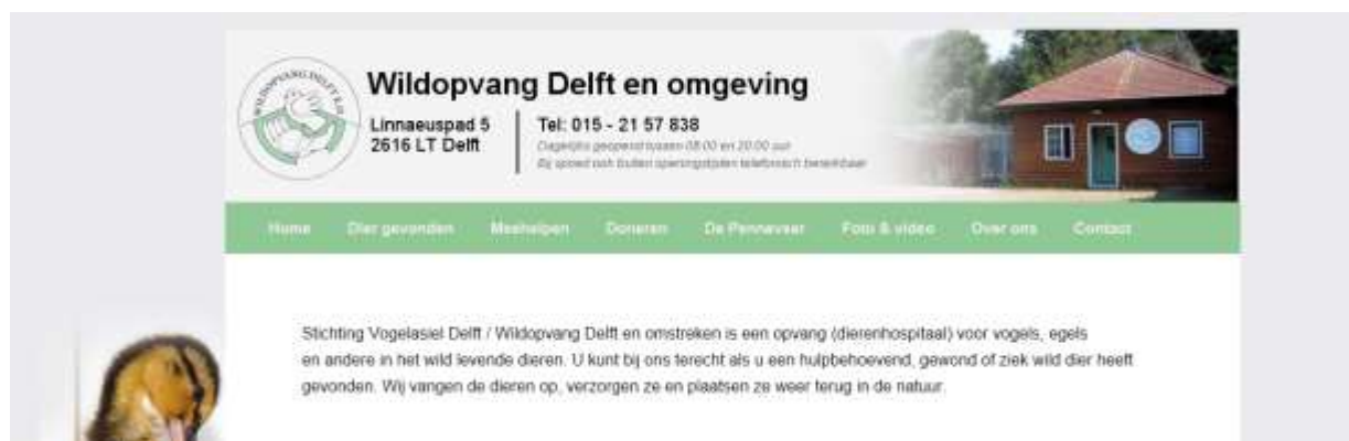
Figuur 6. Nieuwe homepage